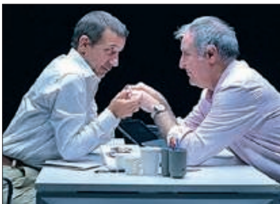
'El crèdit', un duel de luxe

GRANS ÈXITS I CARES CONEGUDES EN LA CARTELLERA