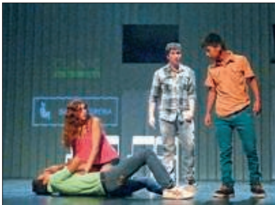
'Ballant amb la mort', de Xarxa