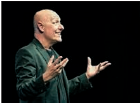
'Els homes són de Mart...'