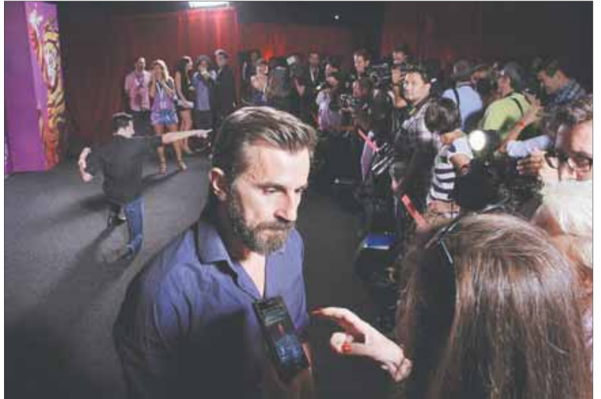
Santi Millán fue uno de los primeros famosos en llegar a la carpa.