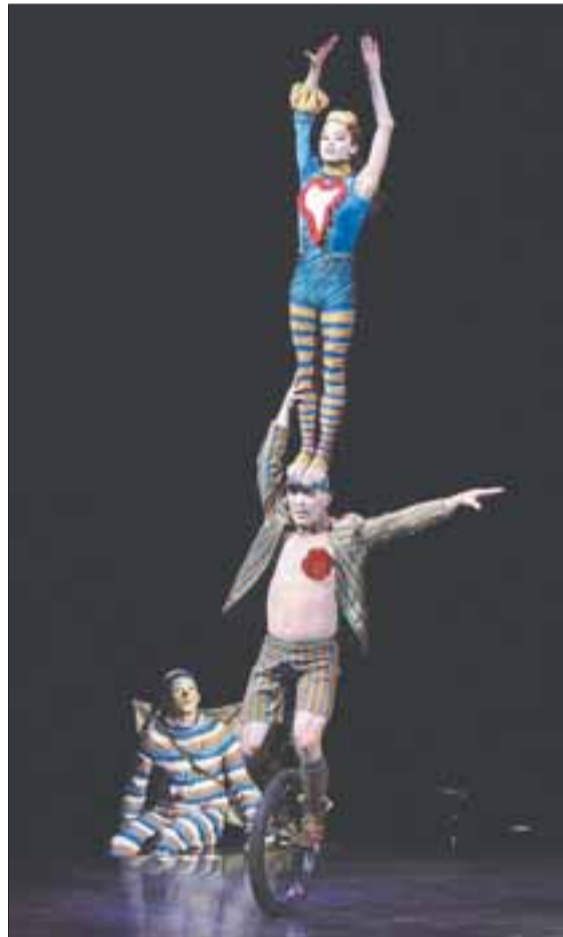
El número ‘unicycle’ dúo dejó boquiabiertos a los espectadores.