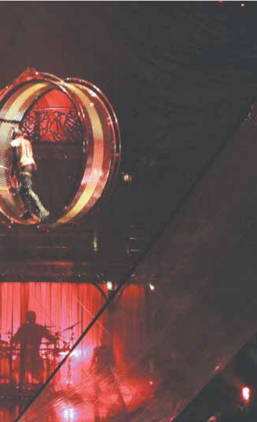
La rueda de la muerte fue uno de los números más aclamados de la noche.

‘No sé cómo un ser humano es capaz de hacer todo esto’, decía Jaume Jané, un espectador