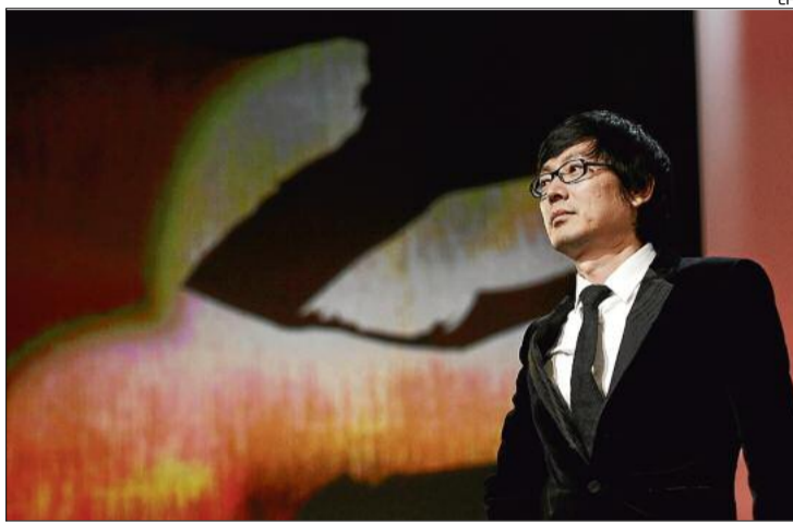
El director xinès, ahir a la Berlinale, en ser declarat guanyador.

Per la seva banda, el mestre francès de la Nouvelle Vague, Alain Resnais, va ser distingit amb el Premi Alfred Bauer de la Berlinale –que guardona les pel·lícules que obren noves perspectives en el setè art– per Aimer, boire et chanter . Resnais, de 91 anys, torna a adaptar en aquesta cinta una obra del dramaturg britànic Alan Ayckbourn, i ho fa a manera de teatre filmat. La pel·lícula ja es va alçar divendres amb el premi FIPRESCI de la crítica internacional.