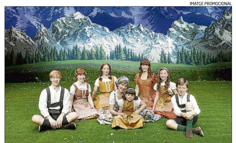
Repertament amb tots els germans Von Trapp i la novia Maria

Les entrades per a les set funcions del musical que es faran al Kursaal del 3 al 6 d'abril es posaran a la venda aquest dijous, a les 18 h.