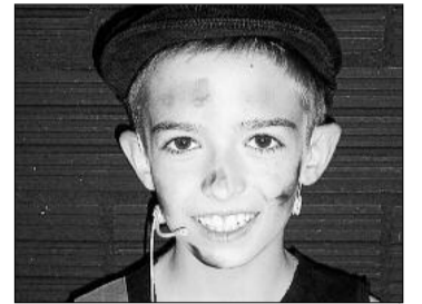
VALL DE VILARAMO

SURIENC, DE 10 ANYS, QUE FA EL PAPER DE SAMMY, L'ESCURA-XEMENEIES