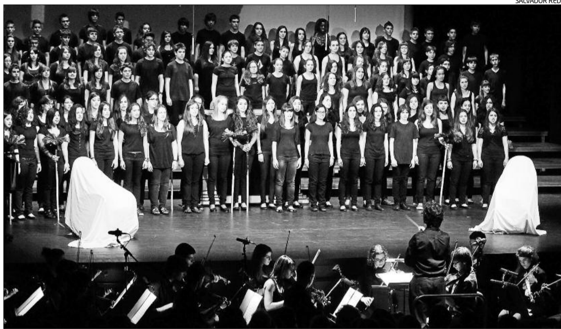
El cor que va participar en la funció de dimecres, amb prop de 200 alumnes d'institut de la Catalunya Central

El resultat mereix una nota «alta per la complexitat d'un espectacle i tenint en compte que, en aquestes edats, el gènere operístic no té ganxo», diu Arguijo. A més, la iniciativa s'ha posat en marxa amb una bona dosi de risc: només un