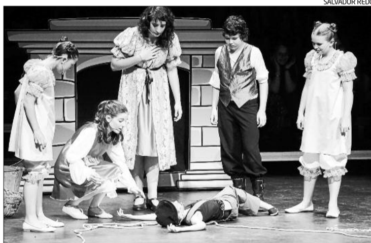
Els nens que protagonitzen l'obra han estat escollits en càstings