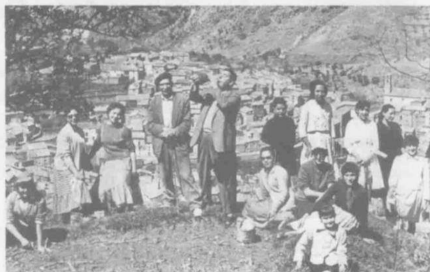
Excursión a la Cueva de los Santos, con Bcares al fondo.