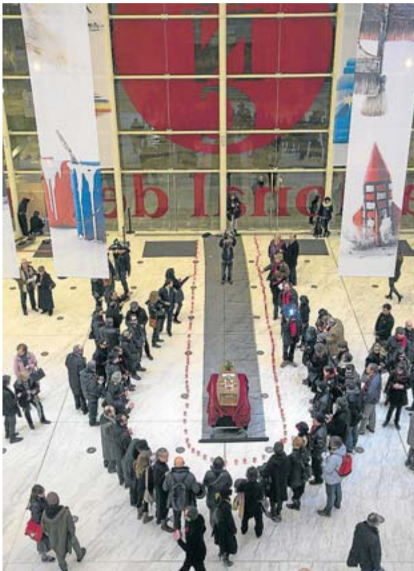
Les retallades van obligar a tancar el 3 de març la Sala Tallers del TNC i els directors i actors li van dedicar un funeral. CRISTINA CALDERER

El Consell acusa el Govern d'haver desatès la cultura i reclama el 2% del pressupost