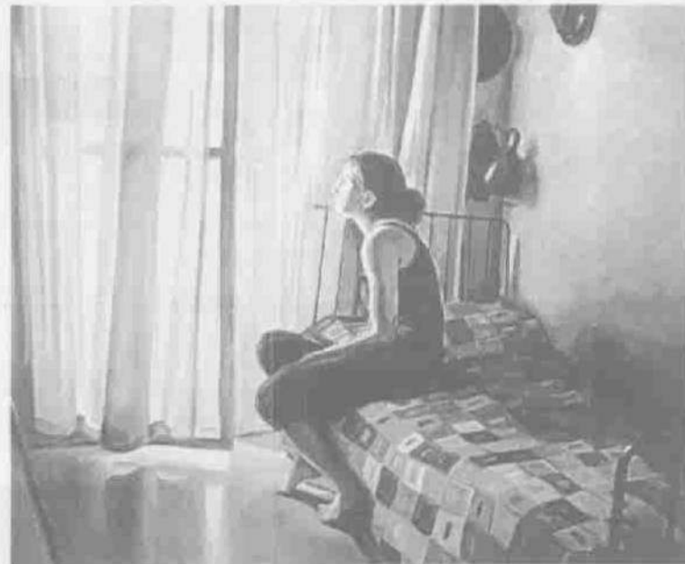
Obra d'Edurne Lacunza al Cub d'Assaig

A la sala Cub d'Assaig, Edurne Lacunza ( El silenci de la intimitat ) porta per primer cop a Belles Arts pintures plenes