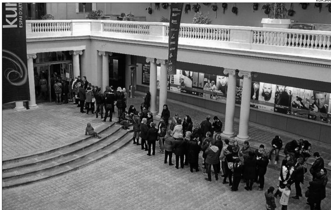
Una llarga cua es va formar ahir al pati del Kursaal amb gent que no es vol perdre «Grease»