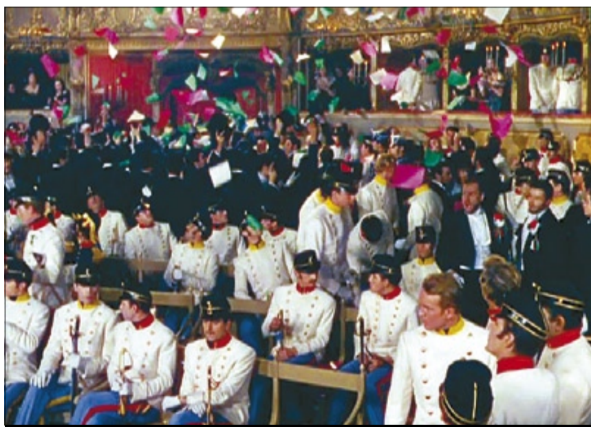
OCTAVILLES ANTIAUSTRÍAIQUES ► Visconti va retratar a la pel·lícula 'Senso' el poder polític i reivindicatiu de l'òpera.