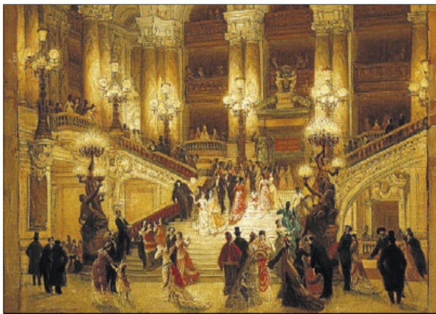
L'ÒPERA DE PARÍS ► El Palais Garnier va ser el gran aparador pel qual va desfilars la nova societat del Segon Imperi.

Però l'òpera va ser així mateix un instrument per a reivindicacions polítiques. El cas més cèlebre és el de Verdi i la unitat d'Itàlia. Quan les òperes del compositor «amb els seus cors provocadors», van començar a representar-se per la península, van aconseguir provocar «una de les escasses experiències compartides» pels italians.