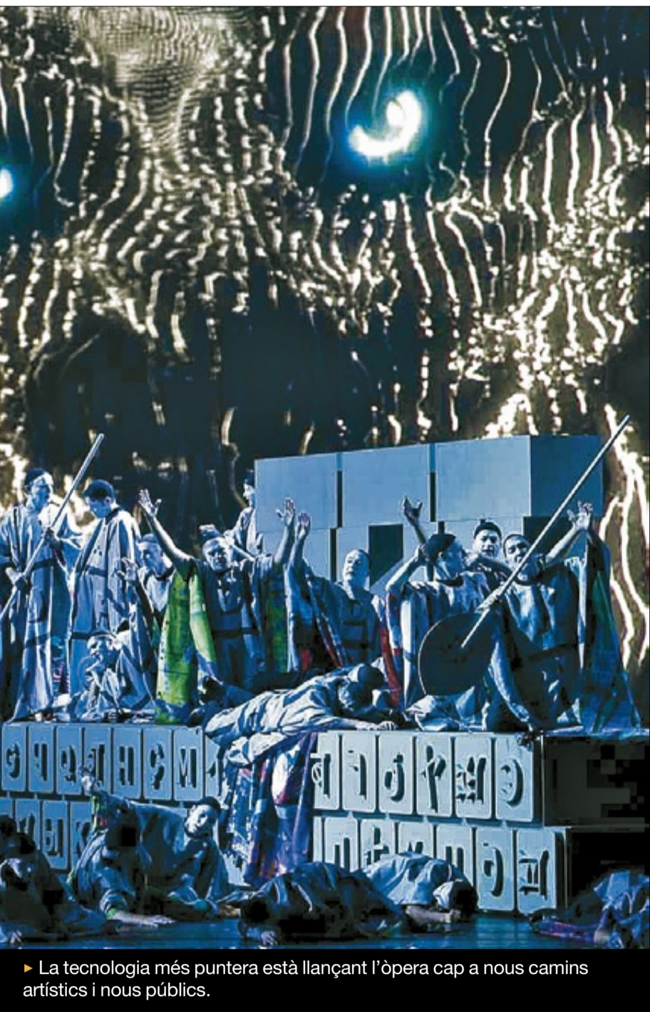
► La tecnologia més puntera està llançant l'òpera cap a nous camins artístics i nous públics.