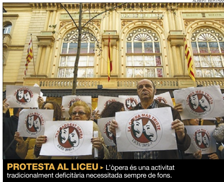
PROTESTA AL LICEU ► L'òpera és una activitat tradicionalment deficitària necessitada sempre de fons.

durant el segle XIX hi va haver 1.100 incendis en grans teatres d'òpera d'Europa i Amèrica. Una sala tenia una vida mitjana de 18 anys.