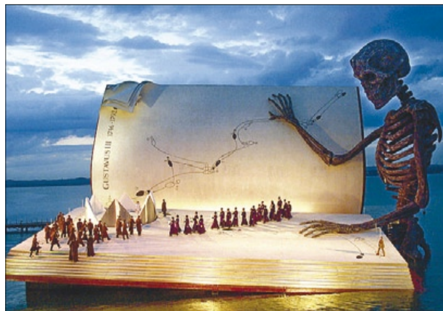
FESTIVAL DE BREGENZ ► El monumental decorat per a 'Un ballo in maschera' marca el predomini del director d'escena.