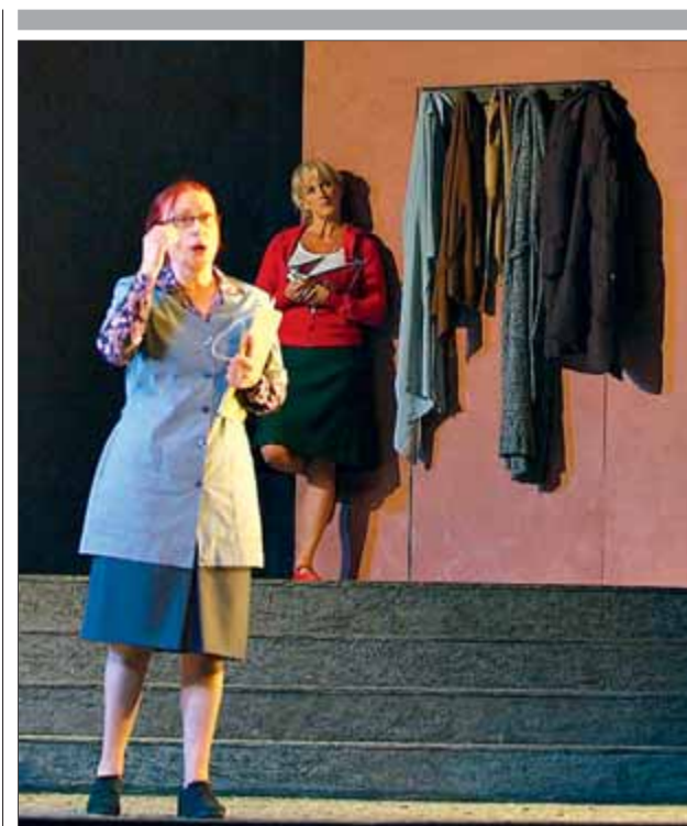
Un dels moments de l'òpera que el director escènic ambienta en una factoria, amb 'botellón' inclòs

* El buen pastor , EUA, 2006. DIR.: ROBERT DE NIRO. INT.: MATT DAMON, ANGELINA JOLIE, TAMMY BLANCHARD.