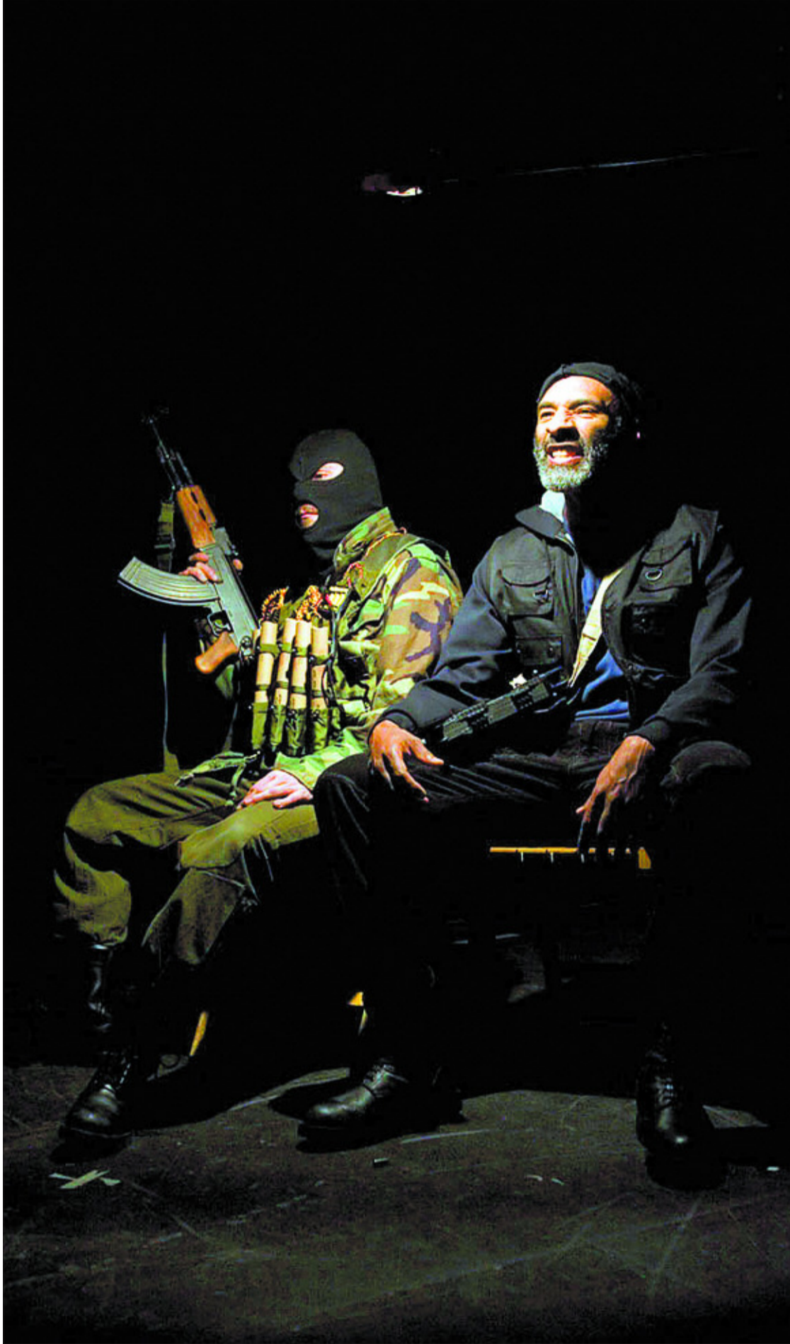
Un momento de los ensayos de Boris Godunov , de La Fura dels Baus.

Para dar forma a esta idea, Ollé acudió al dramaturgo catalán David Plana. Él es el autor de la versión tuneada , como dicen ellos, del texto de Pushkin, fruto de un trabajo de condensación, con un lenguaje actualizado y salpicado de fragmentos de discursos políticos pronunciados por figuras como las de Bush y el Che, entre otros. A su