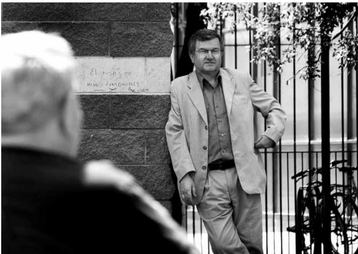
El historiador Richard J. Evans, fotografiado el jueves en Ciutat Vella

Explica el historiador británico que la sociedad alemana, humillada por la guerra, se tornó al mismo tiempo belicista y temerosa. Unos sentimientos que se vieron reforzados por el emergente nacionalismo alemán y el imperialismo, especialmente el del pangermanismo, hacia las comunidades alemanas de Austria, Rumanía y Polonia, así como las tesis de mejora de la raza y la desaparición del débil. Todo ello, enmarcado en el fuerte crecimiento económico e industrial, que empujaba hacia la extensión de las fronteras entre los países vecinos, que