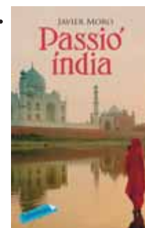
Passió Índia Javier Moro

El 1908 una noia malaguena de disset anys, asseguda dalt d'un elefant luxosament adornat, entra en una ciutat del nord de l'Índia; el poble sencer és al carrer per retre homenatge a la nova princesa de pell blanca com la neu. Així comença la gran història d'amor i passió -i traïció- entre el ric maharajà de Kapurthala i Anita Delgado, una dona de personalitat irresistible que va ser fidel als seus sentiments fins que va aconseguir la llibertat. Després de minucioses recerques, Javier Moro ens revela els secrets d'un dels escàndols més grans de l'Índia sota la dominació anglesa i ens trasllada al fabulós món dels maharajàs, dels harems, de les bacanals, de la passió per les joies, els palaus i el flamenc, els cavalls, els Rolls Royce i les caceres de tigris.