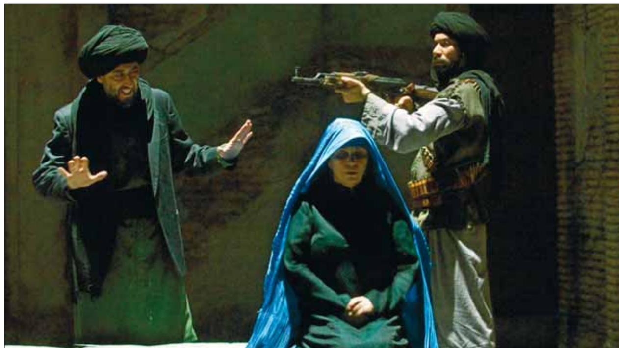
L'obra de Tony Kushner parla d'una dona que decideix viatjar a Kabul

El Teatre Fortuny de Reus acull 'Homebody/Kabul', l'obra d'èxit de Kushner amb direcció de Mario Gas