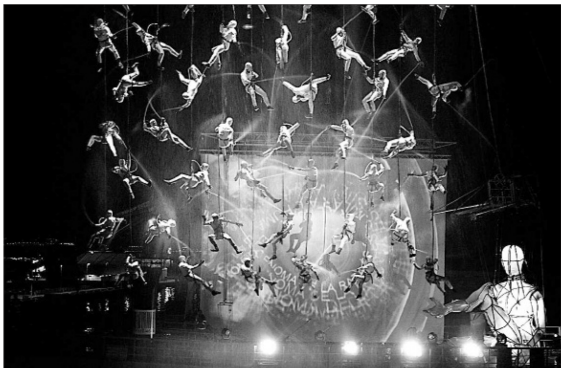
Imagen de una producción de La Fura dels Baus que incorporará a su próximo montaje, Órgano de luz .

Aunque resulte casi insólito, en Mérida no se había estrenado nunca un importante texto que gira en torno a un mito grecolatino. A Electra no le sienta bien el luto , de Eugene O'Neill (del 14 al 24 de julio), tendrá dirección de Mario Gas, uno de los triunfadores de la pasada edición de la muestra, quien ha contado con un puñado de importantes actores: Emilio Gutiérrez Caba, Constantino Romero, Mónica López, Gloria Muñoz, entre otros.