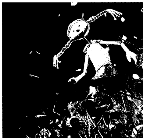
Kla, hija de la familia Gru, es la protagonista de la obra. D. RIJANO

Asimismo en el nuevo espectáculo se ha incorporado la proyección de un audiovisual. Este recurso se aplica en coherencia. En la cúpula de la sala del teatro proyectará las imágenes que observan y comentan los astrónomos cuando miran por el telescopio.