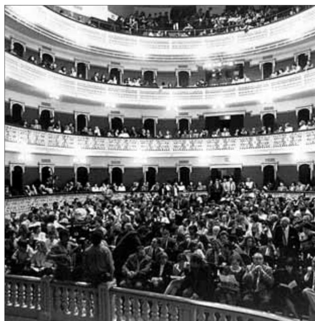
El Teatre Fortuny és un dels més antics de Catalunya i ara celebra el 20è aniversari de la seva reobertura