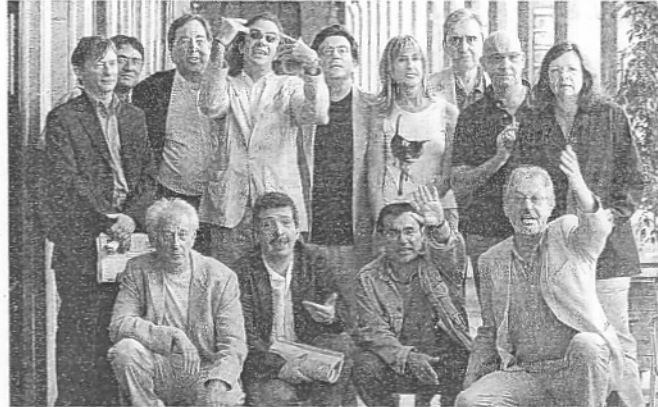
Los impulsores del manifiesto, el día de su presentación

Así lo apuntaron ayer fuentes de la plataforma, cuyos integrantes celebraron anoche una nueva reunión prepa-