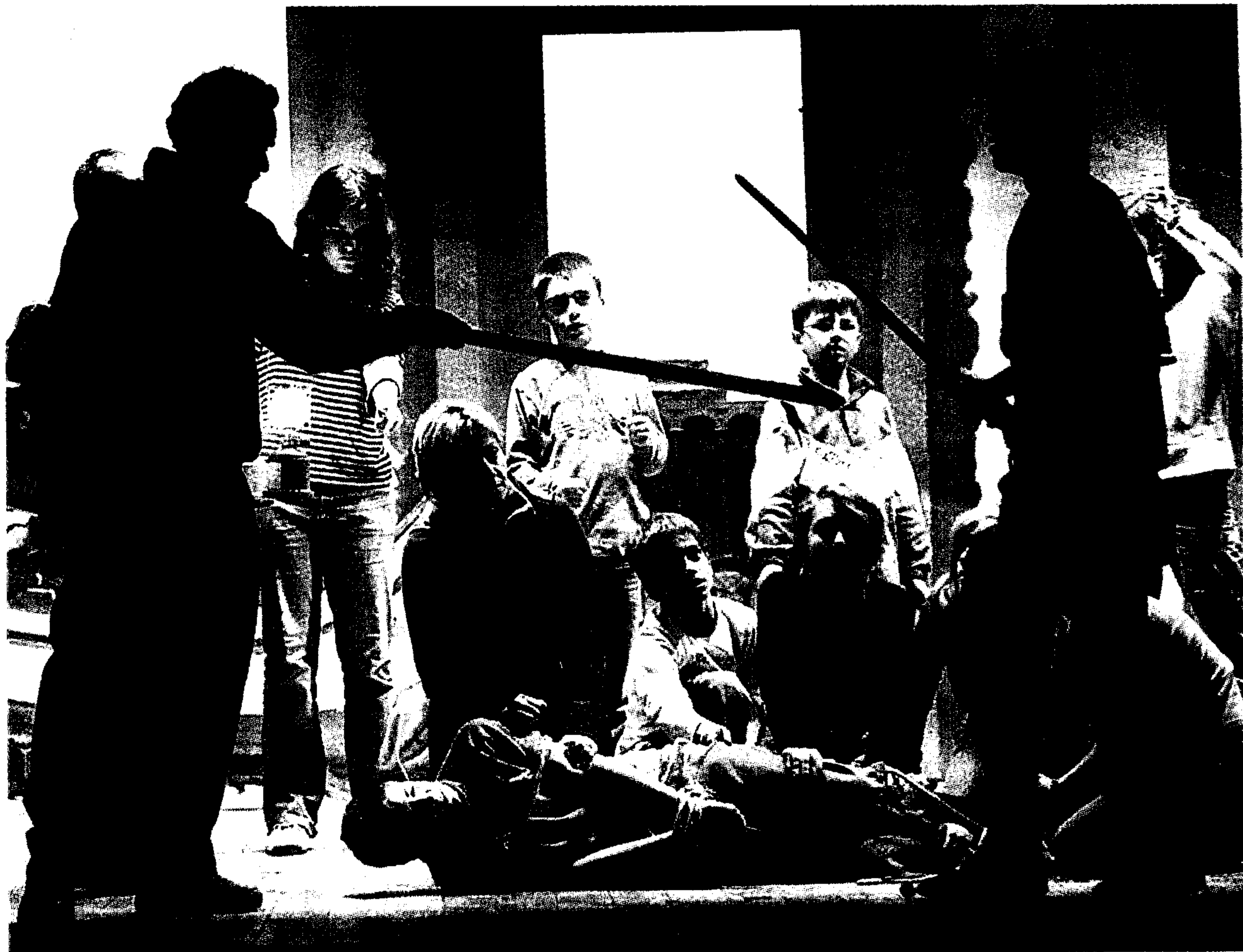
El último ensayo de "L'illa del tresor", el jueves por la noche, en el Centre Parroquial de la Santa Creu. CRISTÓBAL CASTRO