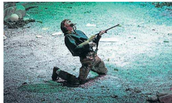
Una escena de Kind , de la companyia Peeping Tom, que es representa avui i demà al TNC. OLYMPETTIS / TNC