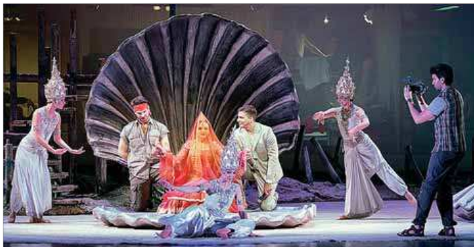
L'òpera de Bizet feia més de 50 anys que no es representava al Liceu ■ JOSEP LOSADA

Quan l'any 1863 George Bizet, un dels representants del gust francès del segle XIX per l'exotisme, va compondre Les pêcheurs de perles amb un llibret ambientat a Ceilan, faltava més d'un segle perquè aquesta illa asiàtica es convertís en Sri Lanka, on, traslladant l'acció a la contemporaneïtat, transcorre la posada en escena concebuda fa uns anys per Lotte de Beer, per a una producció del Theater an der Wien, i reposada al Liceu per Dorike van der Genderen. Considerant la necessitat de fer més atractiva una òpera amb un llibret pròxim al ridícul sobre la rivalitat entre dos amics (Nadir i Zurga) per l'amor d'una sacerdotessa