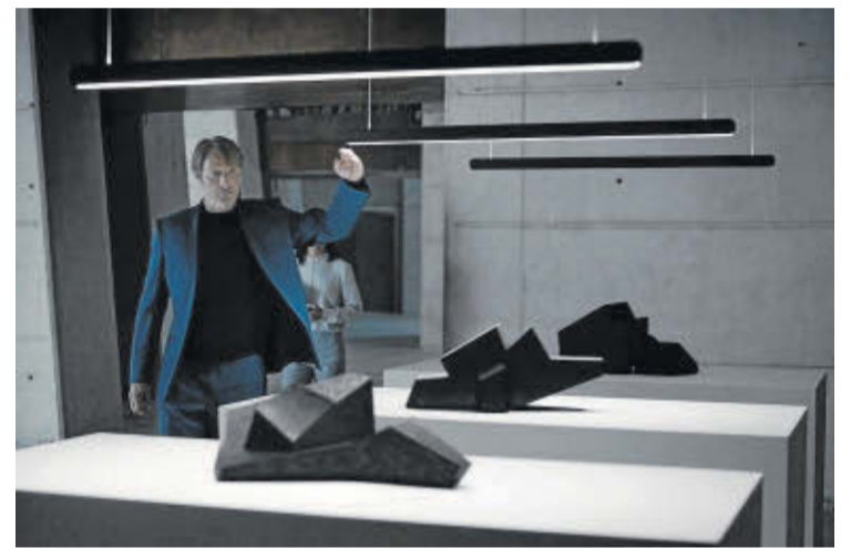
Captura del vídeo promocional de la empresa Occhio, rodado en el Palau Firal i de Congressos de Tarragona.

Mikkelsen, de origen danés, está considerado un actor de culto, en parte por su interpre-