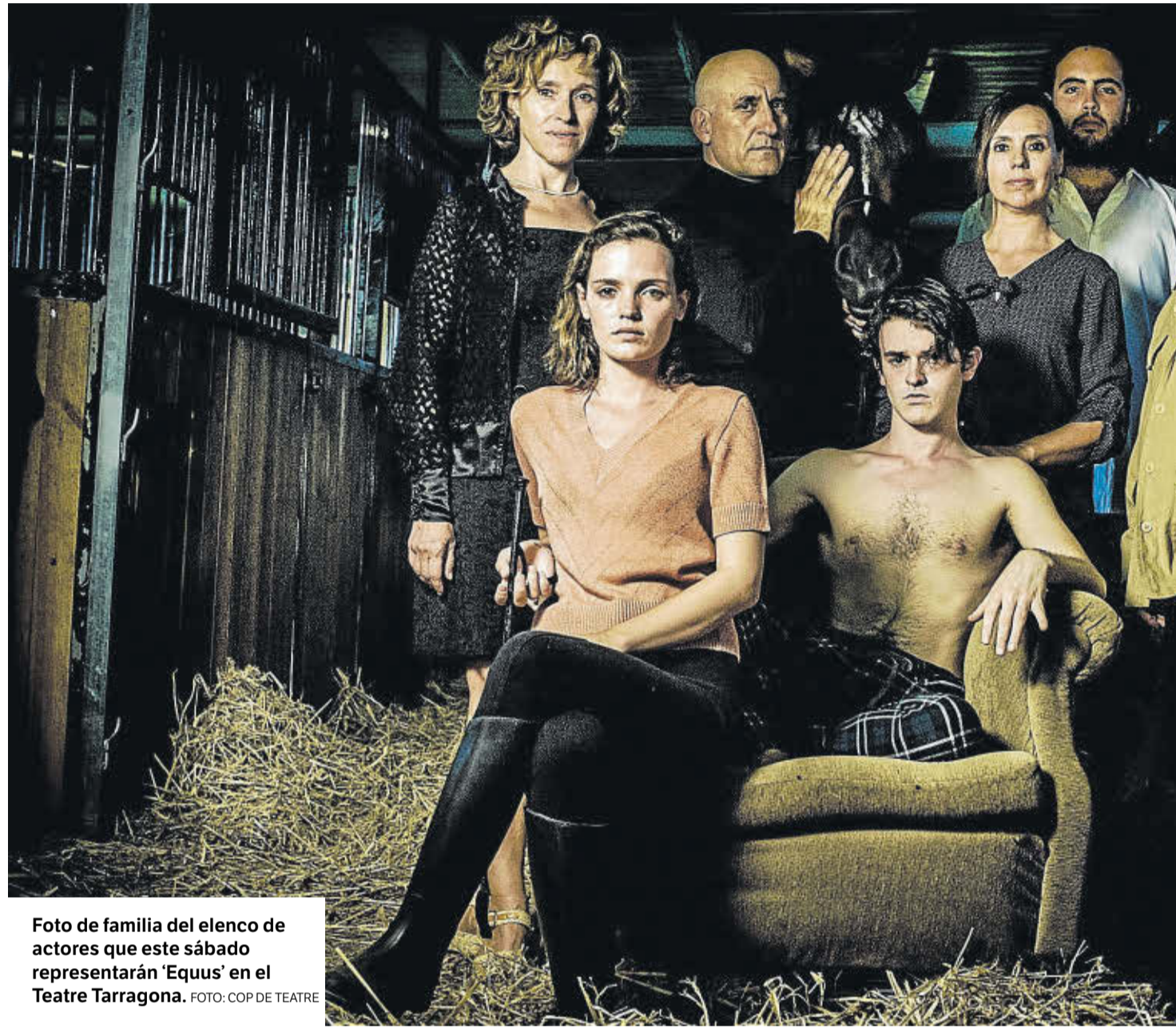
Foto de familia del elenco de actores que este sábado representarán 'Equus' en el Teatre Tarragona.