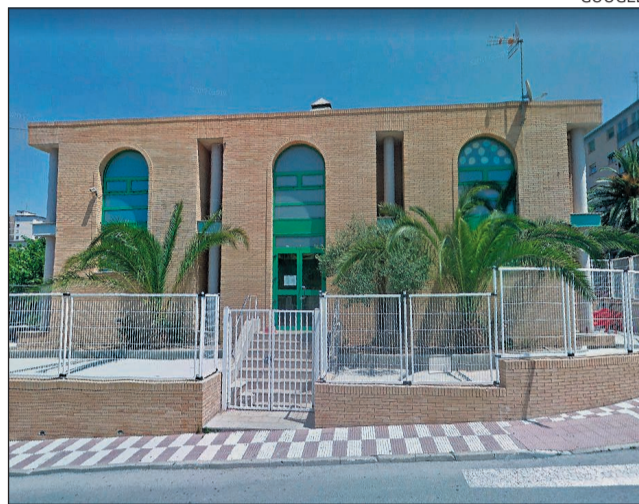
Imatge de l'exterior de la seu de la colla castellera.

En el decurs de la inspecció visual que es va practicar es van apreciar fissures en el revesti-