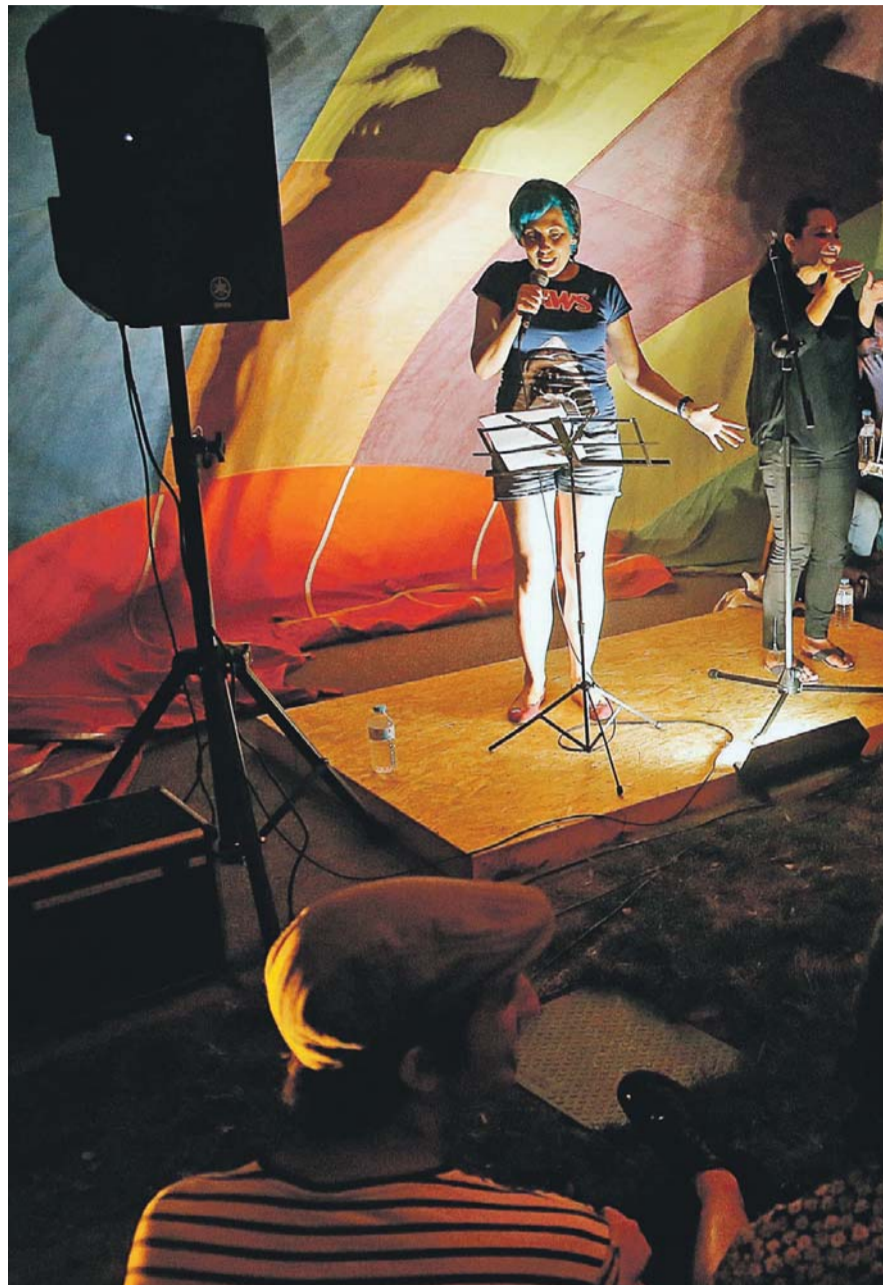
Una imagen de "La Ràtzia", en una edición anterior.

descubrir lo intangible, de lo que no se puede explicar, de lo que no se puede ver pero todavía está presente y que, si lo sabemos escuchar, nos revelará algo de nosotros mismos." Una prometedora sinopsis de un montaje que sólo podrán disfrutar unos pocos.