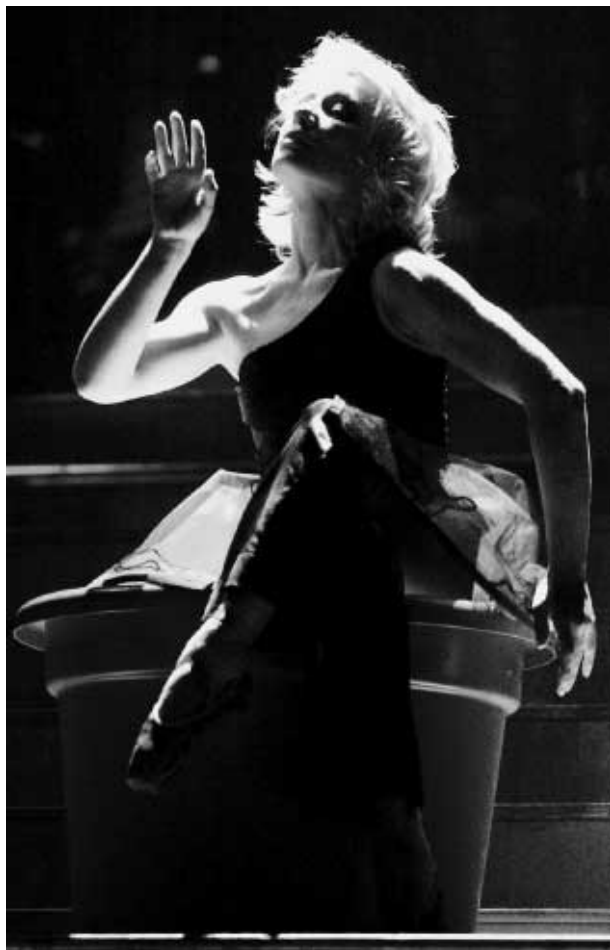
Sol Picó durante su actuación en Valencia, el pasado día 16, en la gala de los Max

La Generalitat impulsa un plan piloto de residencias para las compañías