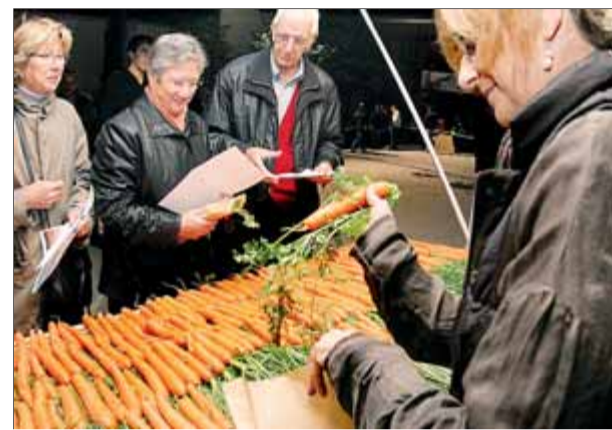
Venda de pastanagues en lloc d'entrades, el 2012 al Teatre de Bescanó, per a la funció de 'Suïcides'