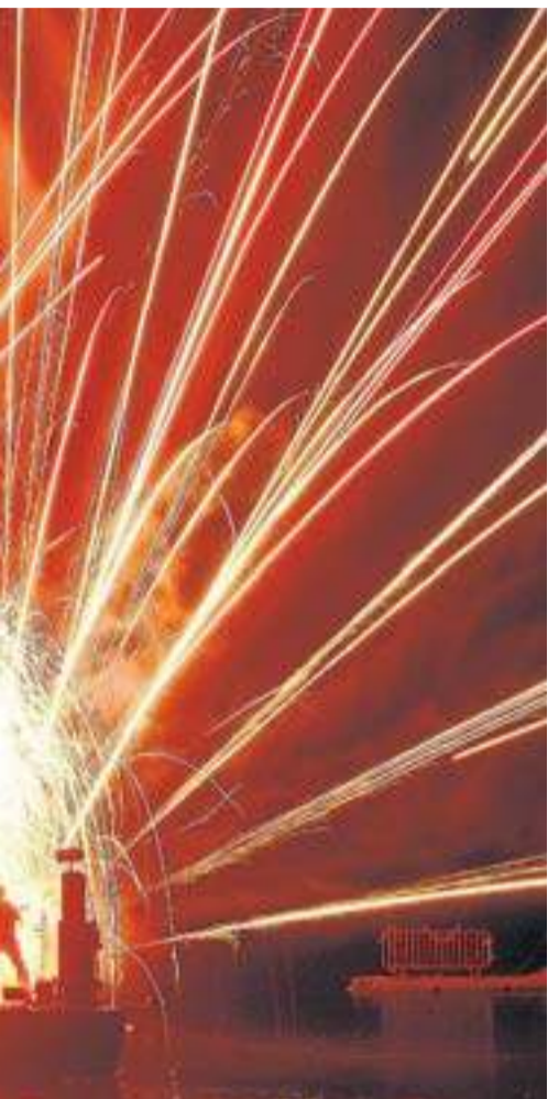
FESTIVAL AL CARRER DE VILADECANS

(Elastic) i, principalment, grups arribats de diferents llocs de l'Estat. Això també és una mica fruit de la conjuntura econòmica: en els últims anys el festival ha reduït el nombre de dies i s'ha concentrat en companyies més properes.