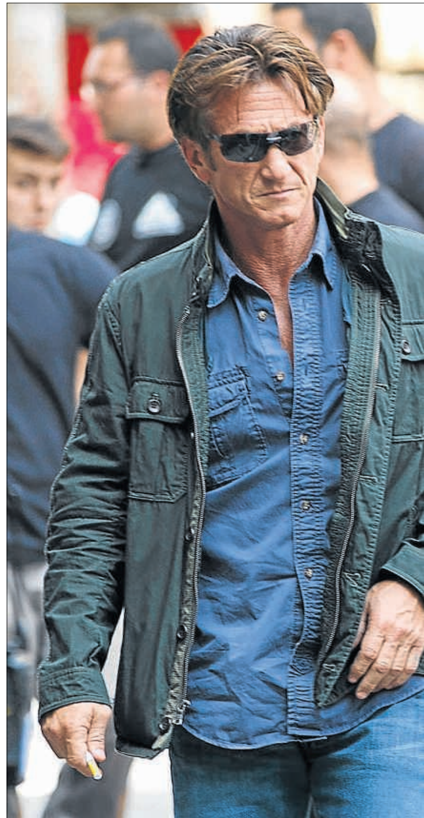
Sean Penn, ahir a Barcelona

TENIU MÉS INFORMACIÓ SOBRE AQUEST TEMA AL WEB www.lavanguardia.com