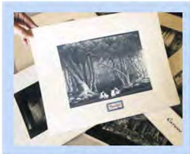
Fotografia d'una representació de Parsifal , de Richard Wagner.