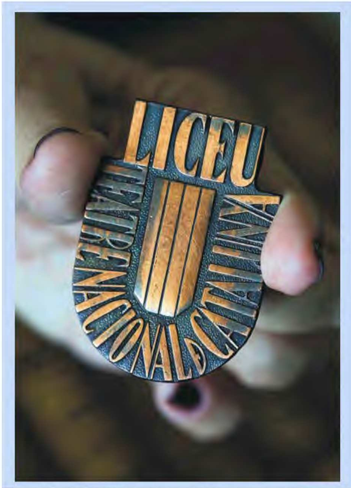
Insígnia creada pel Govern de la Generalitat republicana el 1936 després de nacionalitzar el Liceu per protegir-lo.