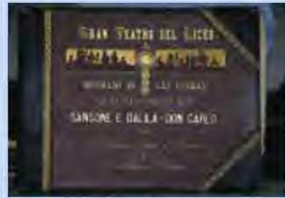
Carpeta amb decorats d'òperes.

► Història de l'edifici. 800 registres, la majoria plànols, i la resta, documents i fotografies amb les diferents reformes de l'edifici, tant de la reconstrucció de 1861-1862 i altres obres rellevants (com ara un projecte de 1922 del qual es