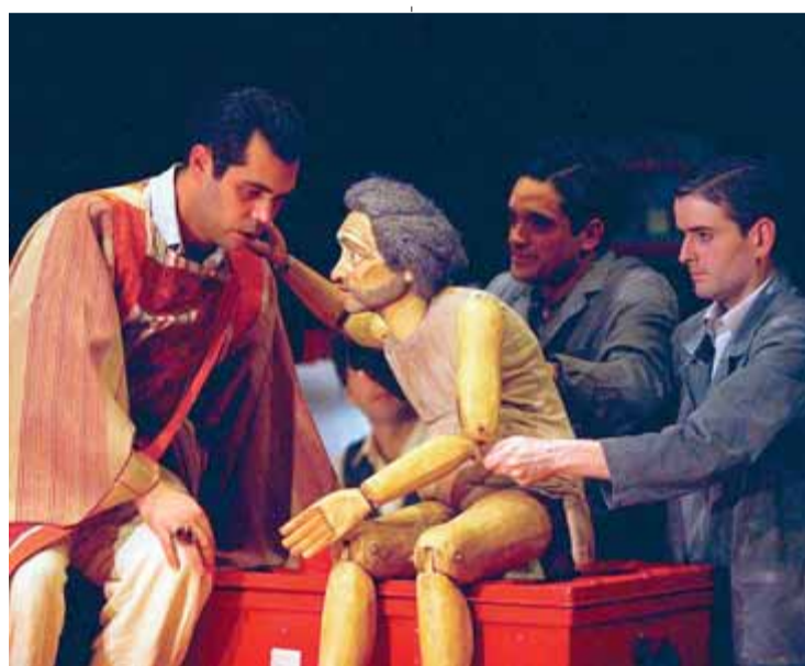
Un detall de 'Primera història d'Esther', del 2007, al TNC

Els centres d'arts escèniques van confiar en Joan Ollé perquè fes un homenatge al vers d'Espriu a El jardí dels cinc arbres