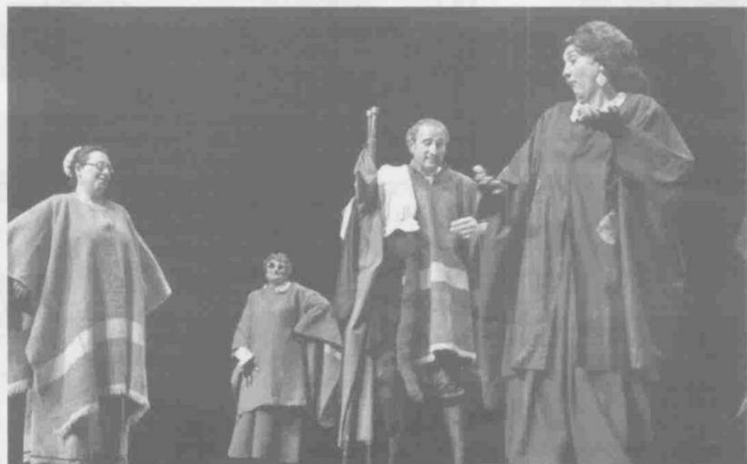
Representación de la obra "Sombras de amor prohibido", en el Teatre Principal. CRISTÓBAL CASTRO

En el Principal con la obra "Sombras de amor prohibido"