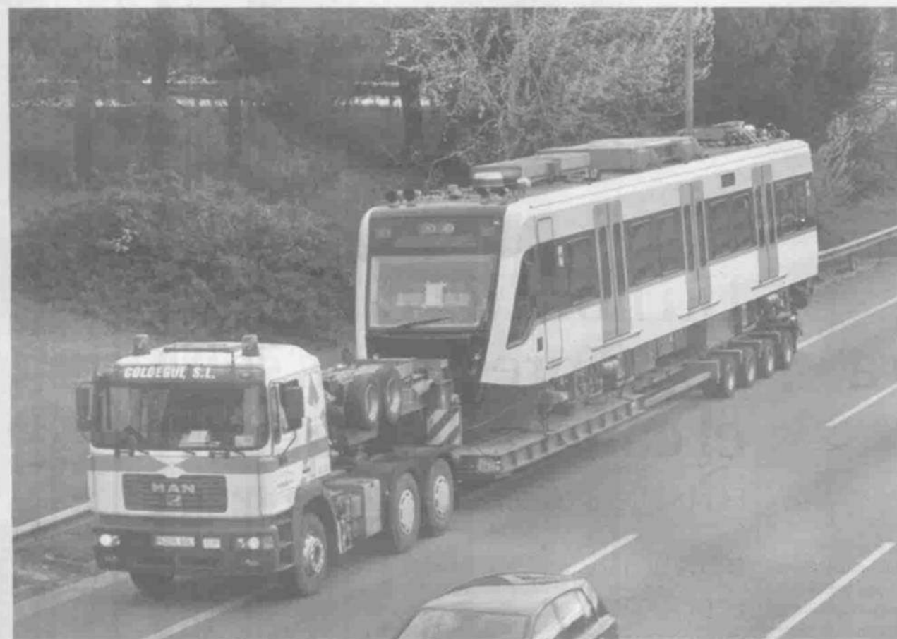
El primer tren de la nueva flota, ayer en el Centre Operatiu de Rubí.

El conseller Santi Vila visitó ayer el primer convoy en Rubí