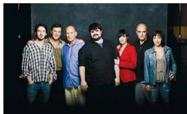
'Pàtria', segona part de la trilogia de Jordi Casanovas sobre la identitat catalana, serà una de les estrenes

La cadena local gironina destaca en un comunicat que la intenció de Temporada alta és "entretenir i explicar tot el que passa" en el festival. El programa pretén, segons explica la nota de Televisió de Girona, que l'espectador conegui "quina és la programa-