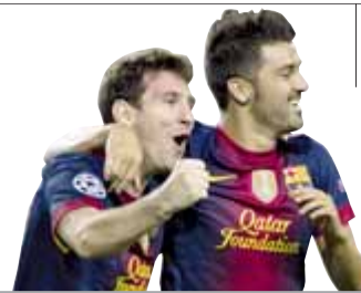
Benfica-Barça, el gran partit de la jornada de Champions

TV3 i TVE emeten avui en obert el segon partit dels blaugrana en la lligueta de la competició (20.45 h)