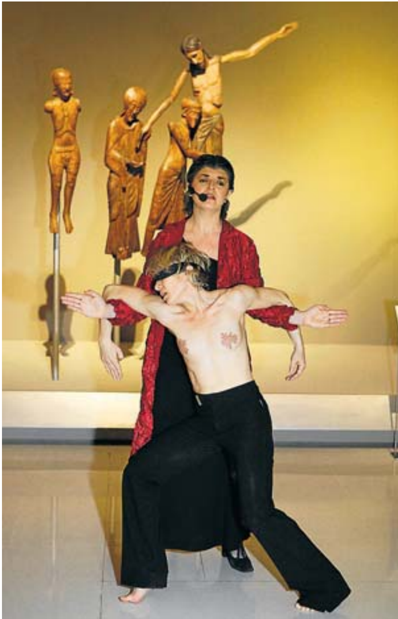
La sinuositat de Sol Picó contrasta amb la rigidesa de les talles romàniques com el Davallament de Santa Maria de Taüll . MANOLO GARCÍA

L'espectacle comença al davant de l'absis de Sant Pere de la Seu d'Urgell. En aquest punt Mariona