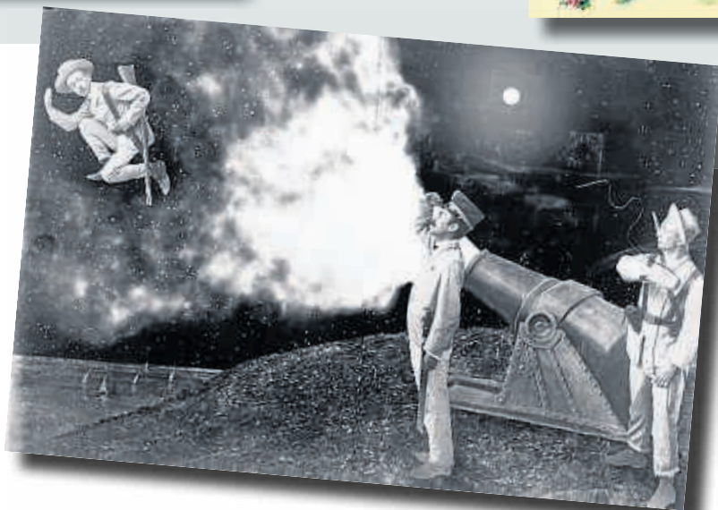
El hombre bala. En lo que Fanés denomina “prehistoria del fotomontaje”, hay momentos deliciosos como esta imagen de 1899 en la que un hombre es disparado por un cañón bajo una lluvia de estrellas

Fanés, autor de Miró. Pintura, collage, cultura de masas (Alianza), entre otros estudios de refe-