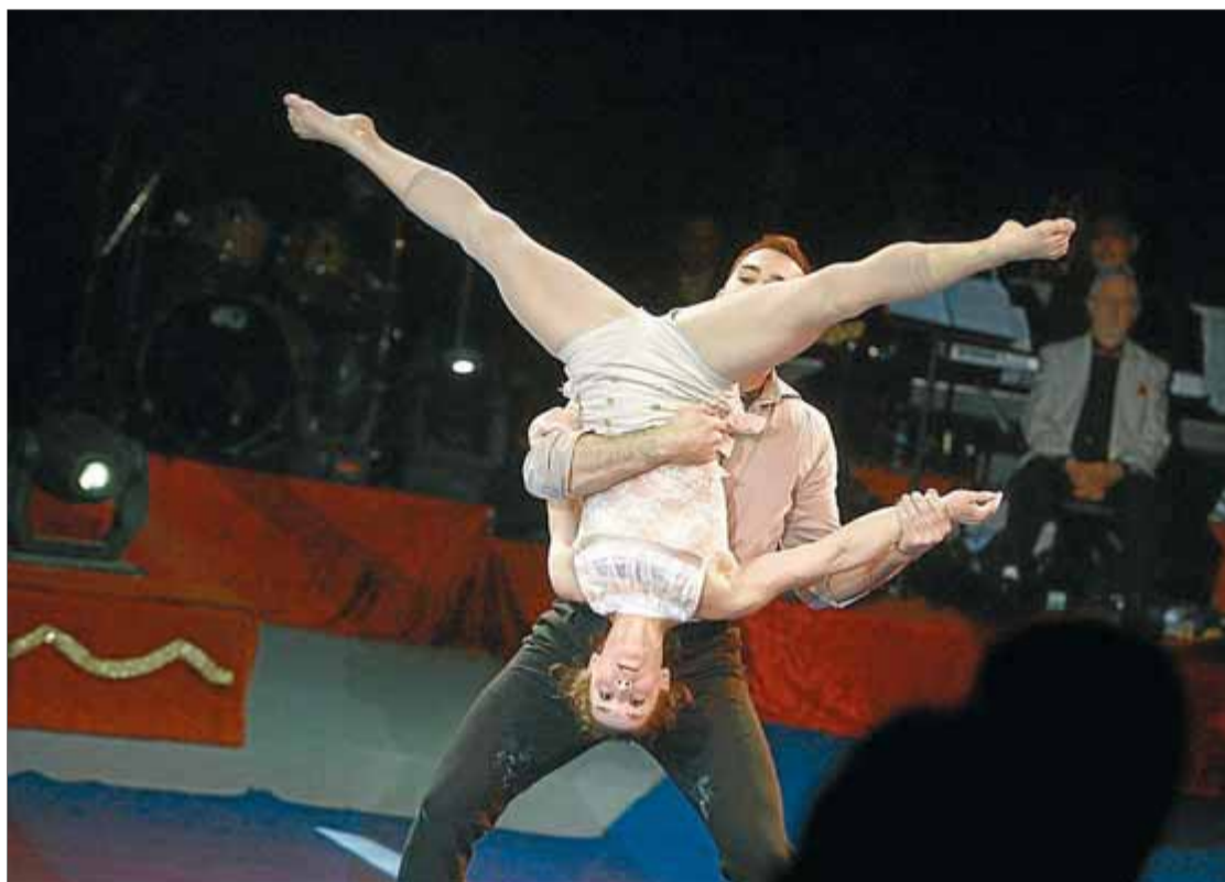
El Duet Dam, en un moment de la seva actuació de dijous a la nit, a la vela del festival

La jornada inaugural de la mostra, amb l'Espectacle Blau, va començar amb un pèl de retard. Es va iniciar amb una mena de litúrgia molt pròpia de les exhibicions, amb els artistes desfilant entre el públic, cadascú amb la bandera del seu país respectiu. El mateix Genís Matabosch era el presentador, el Monsieur Loyal, el Ringmaster, que va