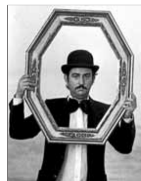
Autoretrat de Lluís Maimí, de l'any 1979. ■ LLUÍS MAIMÍ

(19.30h) amb l'obra del fotògraf Lluís Maimí. Amb aquesta iniciativa, que té el suport de l'àrea de Cultura de l'Ajuntament, es vol contribuir a promocionar i divulgar el treball dels creadors residents a la comarca. En la primera exposició de la nova Sala Empordà, Tra Visconti e Fellini: personatges de pel·lícula al Cafè Florian , Lluís Maimí (1945) retrata l'esplendor i la decadèn-