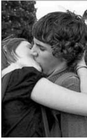
Els dos joves protagonistes de 'French Kissers'.

Però The French Kissers és alguna cosa més. D'una banda recull aquesta tradició francesa que ve del Jean Vigo de Cero en conducta i passa pel