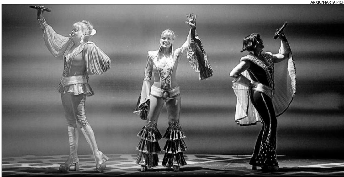
Mamma Mia! va ser l'espectacle més vist del 2011, amb 4.669 espectadors. Els musicals copen els primers llocs

L'Ajuntament manté tota la «confiança», explicava Calmet, en «la bona feina» del tàndem Galliner-Kursaal i en la capacitat d'«entomar reptes». Això es trasllada en una aportació municipal que no disminueix i que és de 674.000 euros en un pressupost de 2.100.000 euros (el 32%). Les entrades suposen el 41%; el lloguer d'espais, el 12%; els patrocinis, el 8%; i l'aportació de la Generalitat, el 7%.