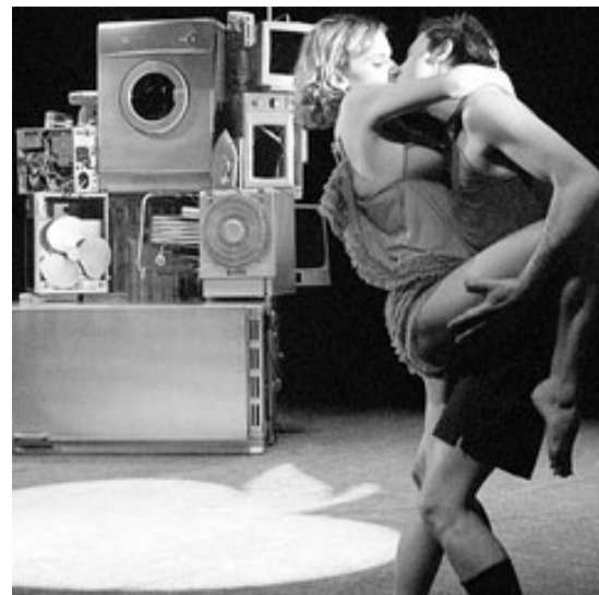
Imatge de l'espectacle Contra el progrés .