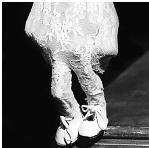
Una imatge d' El cap als núvols .

mer fruit va veure la llum el 2004, i és l'espectacle que es podrà veure avui a Girona. Bobés explica que el que pretén és «jugar com nens explicant històries d'adults», utilitzant alguns titelles, nines de porcellana i diverses joguines per parlar dels adults des de la visió de l'infant, simbolitzat per aquestes joguines. L'espectacle, molt íntim, delicat i poètic, evoca els records d'infància de l'espectador, que es troba molt al damunt de tot el muntatge, al qual l'afavoreixen