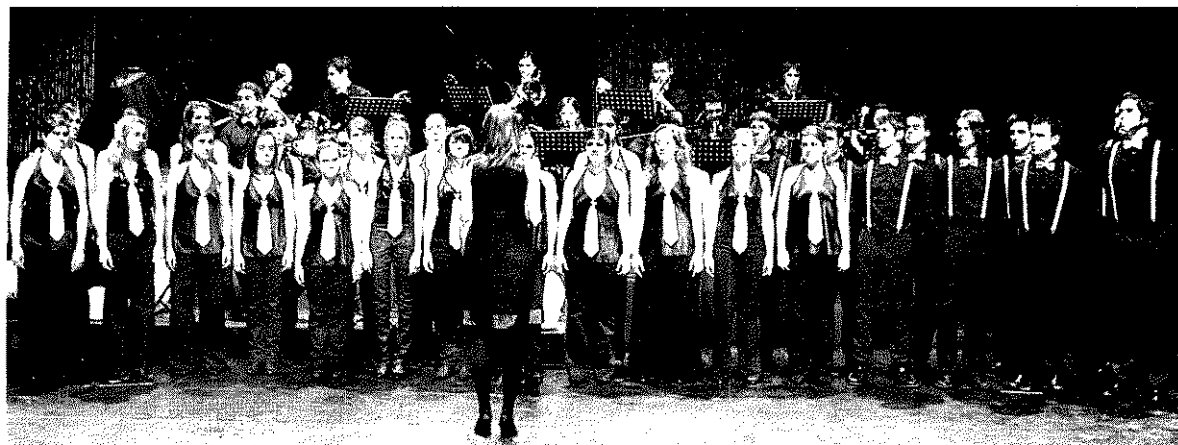
Más de cuarenta jóvenes participan en el espectáculo, que empieza con la interpretación de un villancico.

Las palabras de Humet confirmaban el programa de mano que nos entregaron antes de entrar en la sala. El documento -un folio- recogía un repertorio de dieciocho villancicos clásicos. El recital empezó tal como estaba previsto pero enseguida tomó un rumbo inesperado y se convirtió en una agradable caja de sorpresas. No podemos