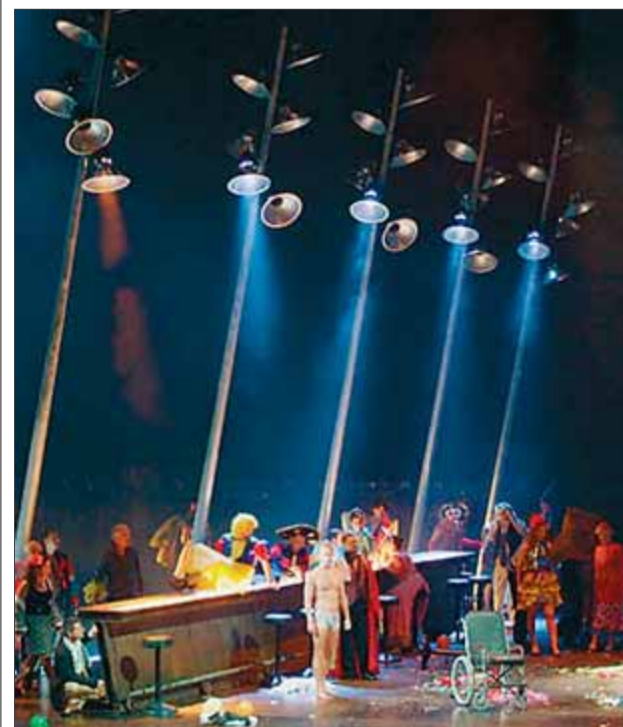
Bieito ha millorat el muntatge respecte al del 2002 gràcies sobretot als tres cantants principals