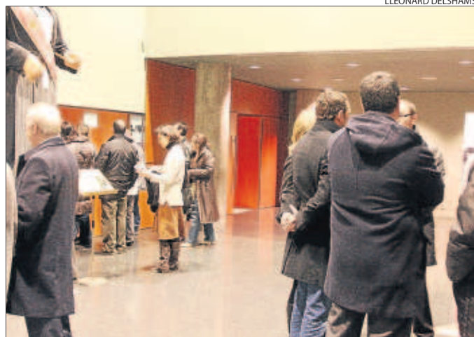
El Auditori registró colas el viernes para comprar las entradas.