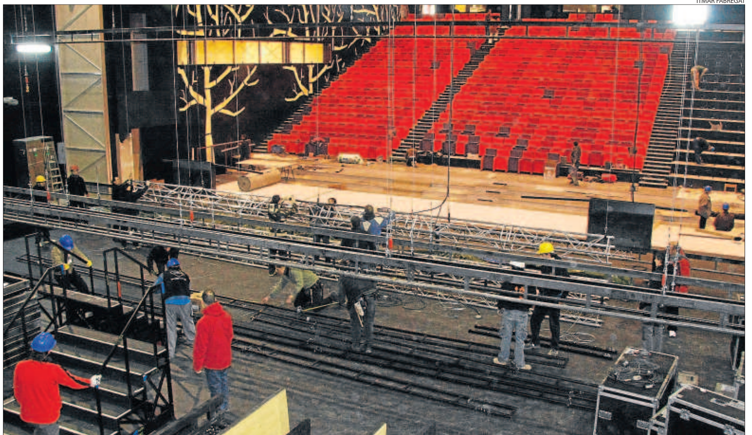
Los operarios iniciaron ayer las instalaciones de iluminación, monitorización y escenografía para la ópera 'Il Trovatore' que inaugurará La Llotja.