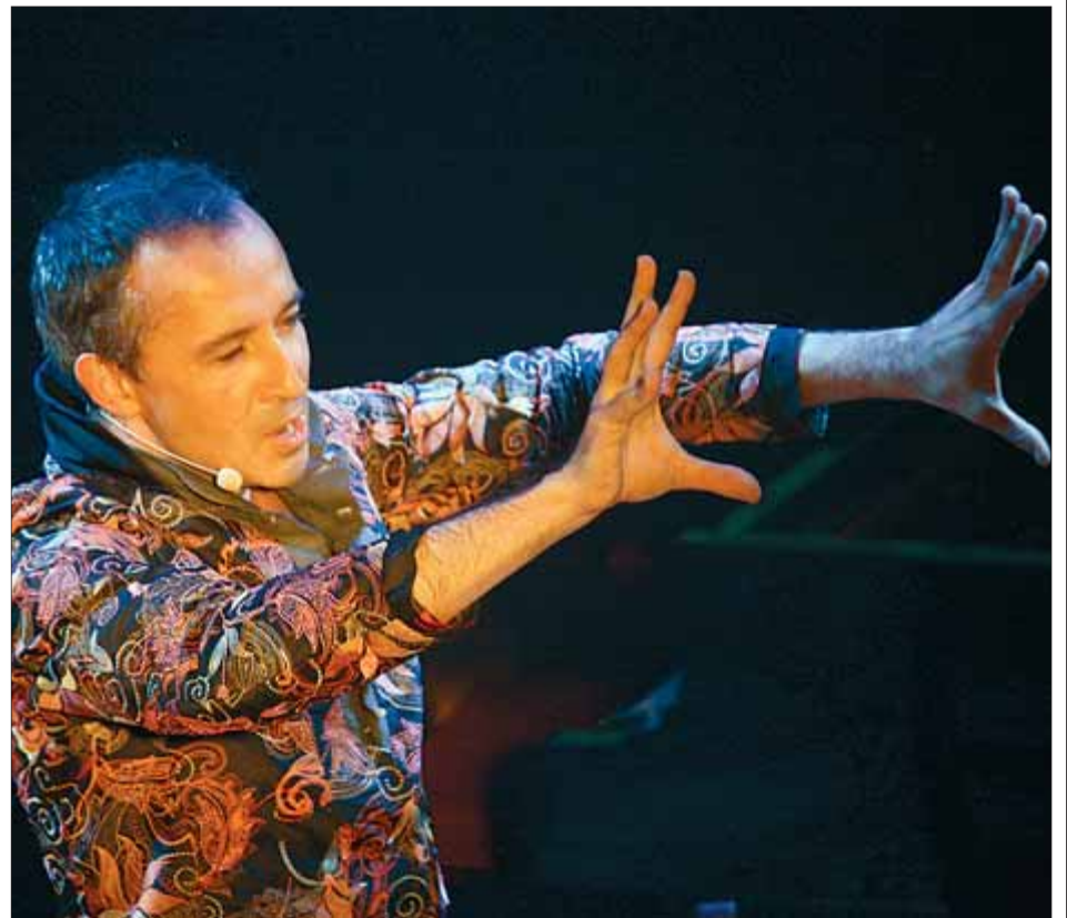
Vilallonga reivindica el cabaret poètic i musical ■ ÀLEX TINTORÉ

Vilallonga recuperarà temes antics, com alguns del musical Aloma , del qual en va escriure la banda sono-