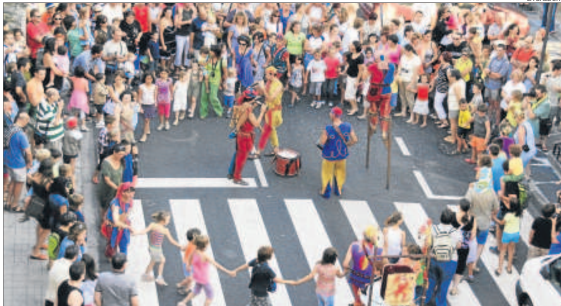
Los Titiriteros de Binéfar llenaron ayer el centro de Esterrí d'Àneu de animación con un pasacalles 'medieval'.

ESTERRÍ D'ÀNEU | La segunda edición del festival de teatro para todos los públicos Esbaiola't arrancó ayer por la tarde en Esterrí d'Àneu con la música de gralles de Kina Creu, acompañada de los cabezudos de esta localidad del Pallars Sobirà, y con un pasacalles 'medieval' protagonizado por los Titiriteros de Binéfar. Fueron los primeros espectáculos de lo que será un largo fin de semana teatral con una veintena de actuaciones a cargo de otras tantas compañías, además de talleres infantiles, pasacalles, animación popular y música tradicional. El festival está organizado por la compañía leridana La Baldufa y el ayuntamiento de Esterrí d'Àneu. En la jornada inaugural, las calles del centro de la población y la pista deportiva (con espectáculo circense a cargo de la compañía Tilt) reunieron a más de 700 espectadores. Por la noche estaba prevista la actuación en la plaza de L'Areny de la compañía organizadora, La Baldufa, con su espectáculo de teatro multidisciplinar El Baró de Munchausen . El festival espera