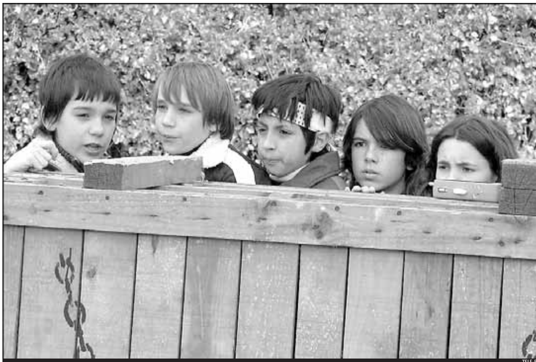
Els nens tenen un protagonisme especial en aquest telefilm de suspens

E l director Paco Plaza roda les darreres seqüències del telefilm 'Cuento de Navidad' a les instal·lacions d'Isla Fantasia de Vilassar de Dalt (Maresme). És un telefilm de gènere fantàstic que pretén explorar "la crueltat, la mesquinesa i l'egoisme" dels nens i les nenes, diu Plaza.