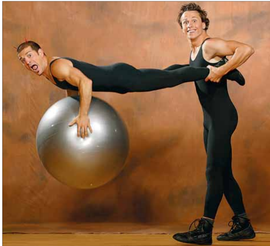
Els canadencs Les Vitaminés proposen una enrevessada dansa còmica