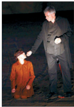
► Imatge de l'obra.

La renovada versió que Jean-Christophe Saïs ha fet de la tragèdia d'Eurípides Andròmaca destaca per la sobrietat i minimalisme escènic i una elegant senzillesa narrativa. Un rectangle dibuixat amb llum per situar el temple de Tetis, on es refugia la protagonista, és pràcticament l'únic artifici al servei del muntatge, a més del refinat suport musical. Les pedres del Grec són utilitzades, amb l'ajuda d'una tènue il·luminació, com a element escenogràfic per recrear un relat concebut per a escenaris històrics com el barceloní i els de Damasc, Lió i Atenes.