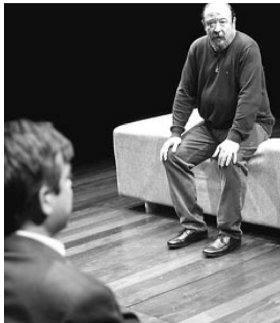
Un instant de l'obra.