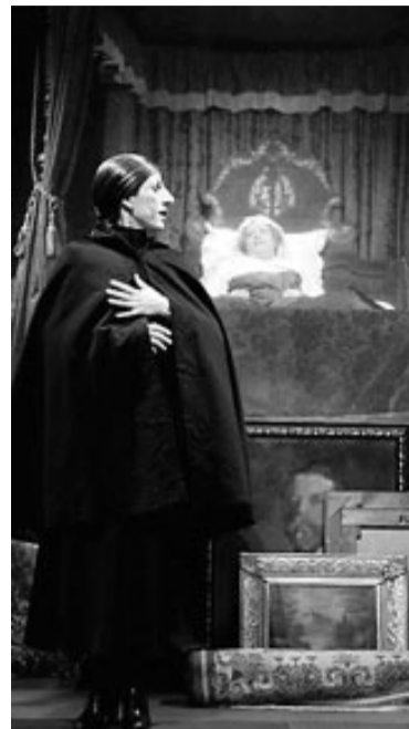
Un instant del muntatge.

Pel que fa a les interpretacions, és un muntatge de conjunt d'alt nivell. Mercè Arànega ofereix un treball superb com a Dona Obdúlia, d'aquells que marquen fita tot i la