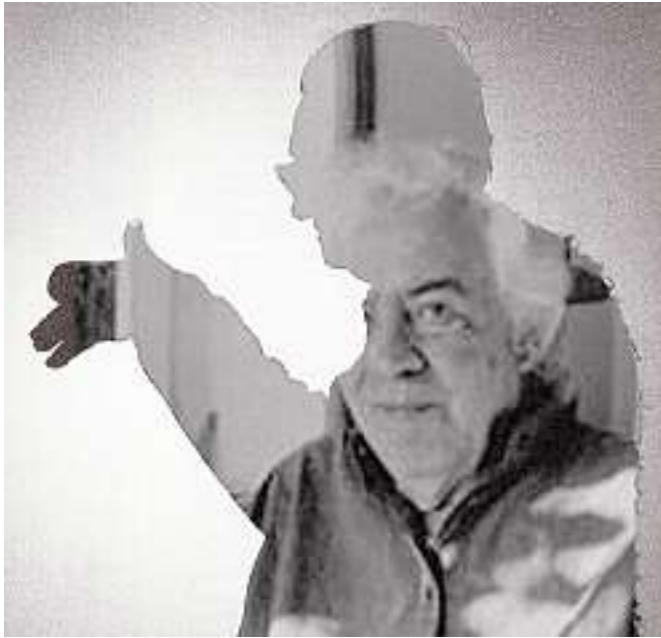
Fotomontaje de la sombra de Brossa y Mestres Quadreny

El ciclo BarriBrossa celebra varios encuentros en el CCCB y en el MACBA sobre la mirada al cine y al teatro de ambos artistas