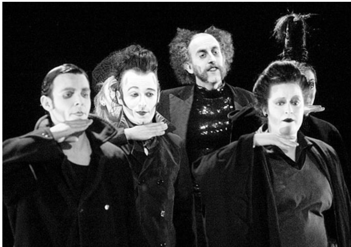
Els protagonistes de la meravellosa Ruddigore o la nissaga maleïda , aquest cap de setmana, a La Planeta.